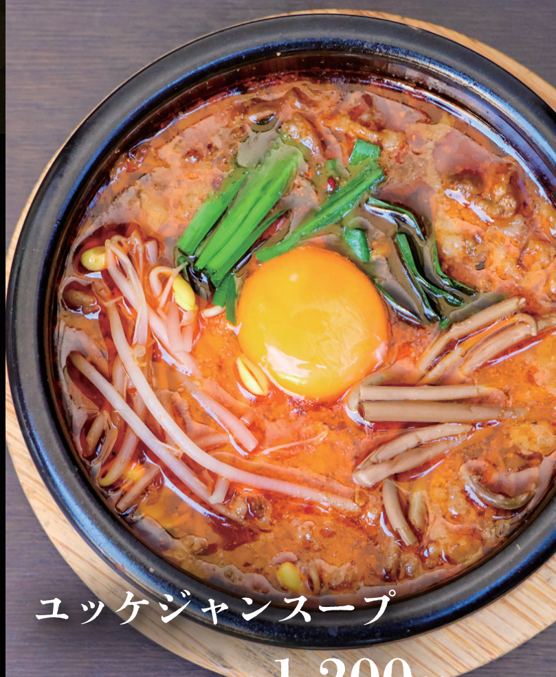
ユッケジャンスープ