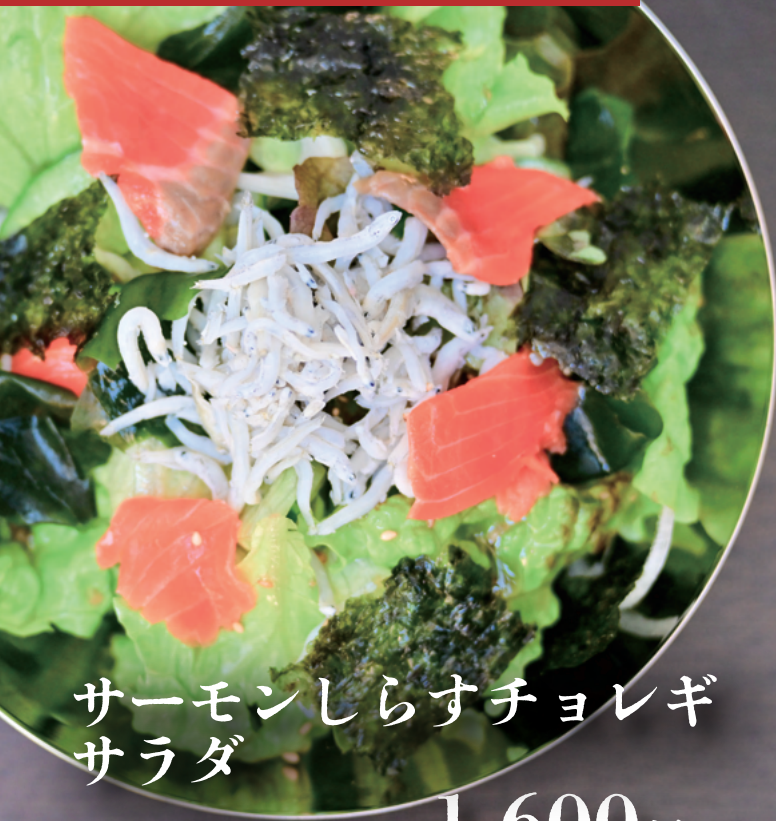
サーモンしらすチョレギ サラダ