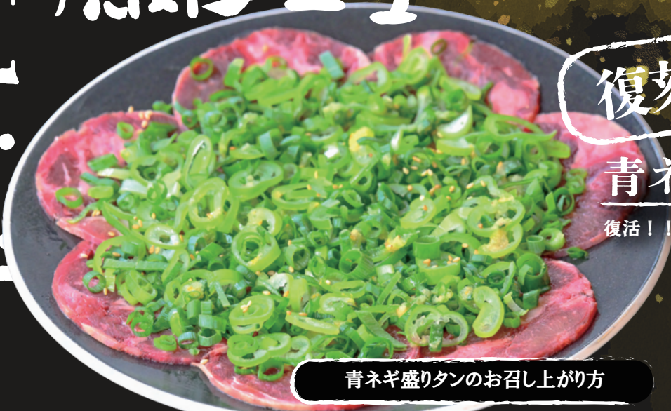
青ネギ盛りタンのお召し上がり方